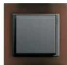
Opak Dunkel- braun