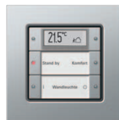
Gira Tastsensor 3 Plus, 2fach Gira E22 Aluminium