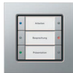
Gira Tastsensor 3 Komfort, 3fach Gira E22 Aluminium