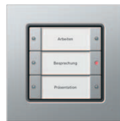
Gira Tastsensor 3 Basis, 3fach Gira E22 Aluminium