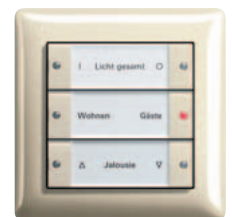
Gira Tastsensor 3 3fach, Reinweiß glänzend Gira Standard 55, Reinweiß glänzend