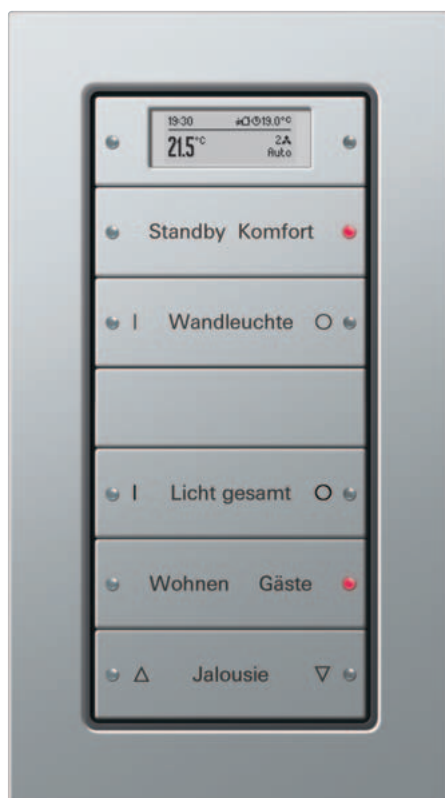
Gira Tastsensor 3 Plus, 5fach, Gira E22 Aluminium