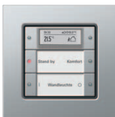
Gira Tastsensor 3 Plus, 2fach Gira E22 Aluminium

Der Gira Tastsensor 3 Plus besitzt einen integrierten Raumtemperatur-Regler sowie ein kontrastreiches Display zur Anzeige von Reglerstatus, Temperatur und verschiedener Meldungen, die über das KNX/EIB System empfangen werden können. Das Display ist im Nachtmodus weiß hinterleuchtet und bietet die Möglichkeit, Werte und Meldungen in unterschiedlichen Größen bzw. Anzeigemodi darzustellen. In Verbindung mit dem Busankoppler 3 mit externem Fühleranschluss kann ein externer Temperaturfühler, z. B. für die Fußbodenheizung, angeschlossen werden.