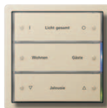
Gira Tastsensor 3 3fach, Reinweiß glänzend Gira Flächenschalter, Reinweiß glänzend