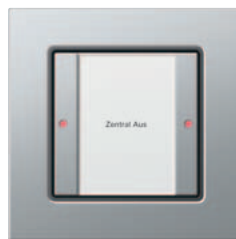
Gira Tastsensor 3 Komfort, 1fach Gira E22 Aluminium

Der Gira Tastsensor 3 Komfort bietet dreifarbige LEDs zur Statusanzeige, die flexibel für komplexere Anwendungen programmiert werden können. Zusätzlich ist ein Temperatursensor integriert, der mit anderen Komponenten des KNX/EIB Systems vernetzt werden kann. Darüber hinaus ist es möglich, jeder Taste eine übergeordnete priorisierte Statusrückmeldung zuzuordnen, z. B. für Alarmmeldungen oder Hinweise wie Windalarm.