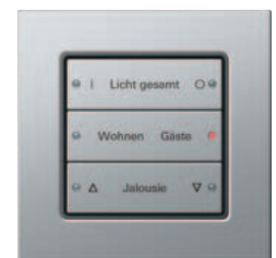
Gira Tastsensor 3 3fach, Edelstahl mit Laserbeschriftung Gira E 22, Edelstahl